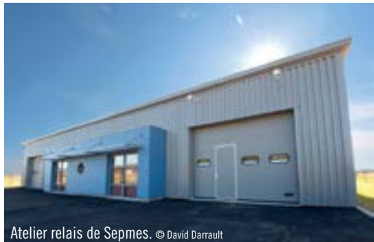
Atelier relais de Sepmes.